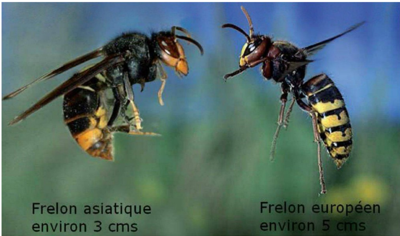
Frelon asiatique environ 3 cms